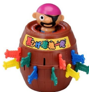
「黒ひげ危機一発」(6代目・2011年～現在)