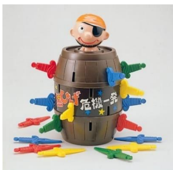
「黒ひげ危機一発ゲーム」(初代・1975年)

1975年(昭和50年)7月1日に発売された「黒ひげ危機一発」は、これまでに80種類を発売し(「超飛び黒ひげ危機一発MAX5」を含めると81種類)、世界47の国と地域で累計出荷数1,500万個を超えるロングセラー商品です。「単純明快なルールで誰もが楽しめる」「ハラハラドキドキの感覚」「すぐに勝負がつく」ことなどが、世界共通、老若男女問わず愛され続けています。遊び方は、ひとりずつ順番にタルの穴に剣を刺し、タルの中の「黒ひげくん人形」を飛び出させた人が負けです(※)。誰が「黒ひげくん人形」を飛ばすかをハラハラドキドキしながら、みんなが一緒に同じ時間、体験を共有し、コミュニケーションを楽しんでいただくことができます。